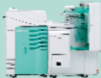
Modèle 2 magasins papier