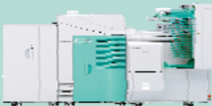
Avec option 4 magasins papier